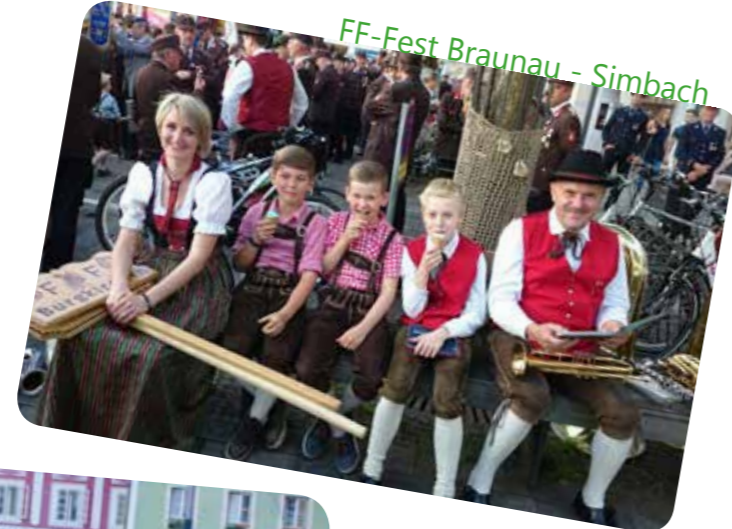
FF-Fest Braunau - Simbach