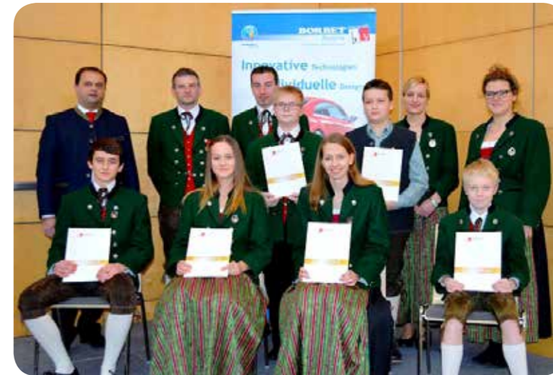
Wir gratulieren herzlich und wünschen noch viele weitere Erfolge!